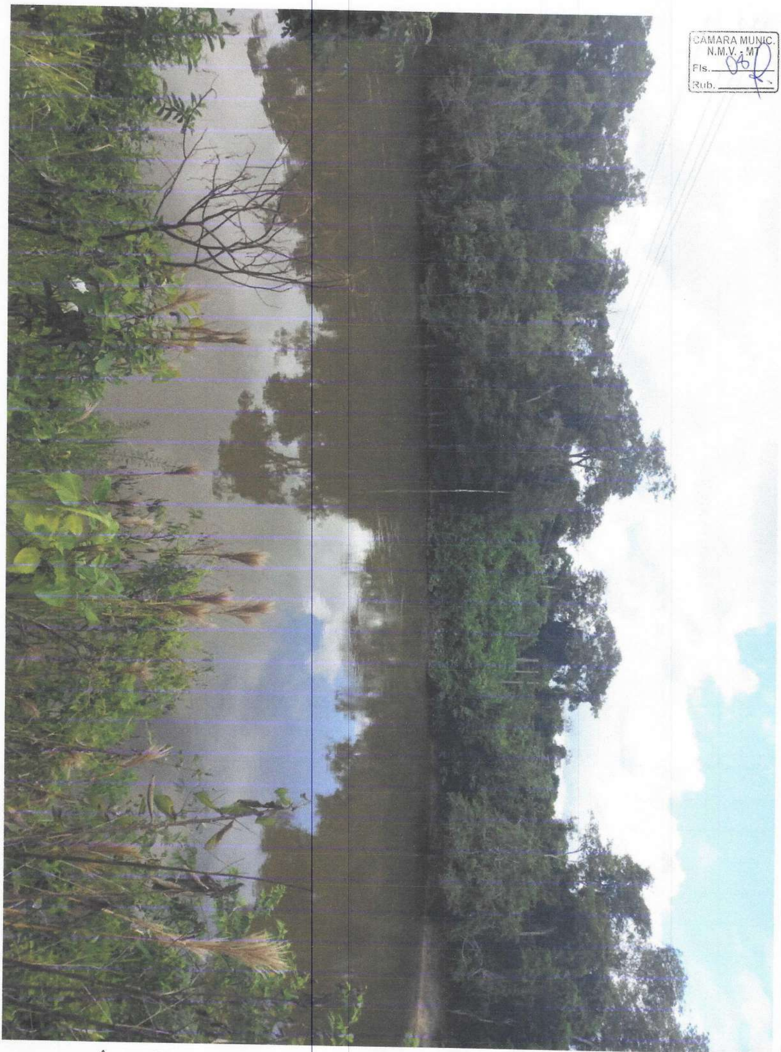
RIO SÃO JOÃO - 19 - MARÇO / 2024

CAMARA MUNIC. N.M.V. - MT Fls. 002 Rub. R.