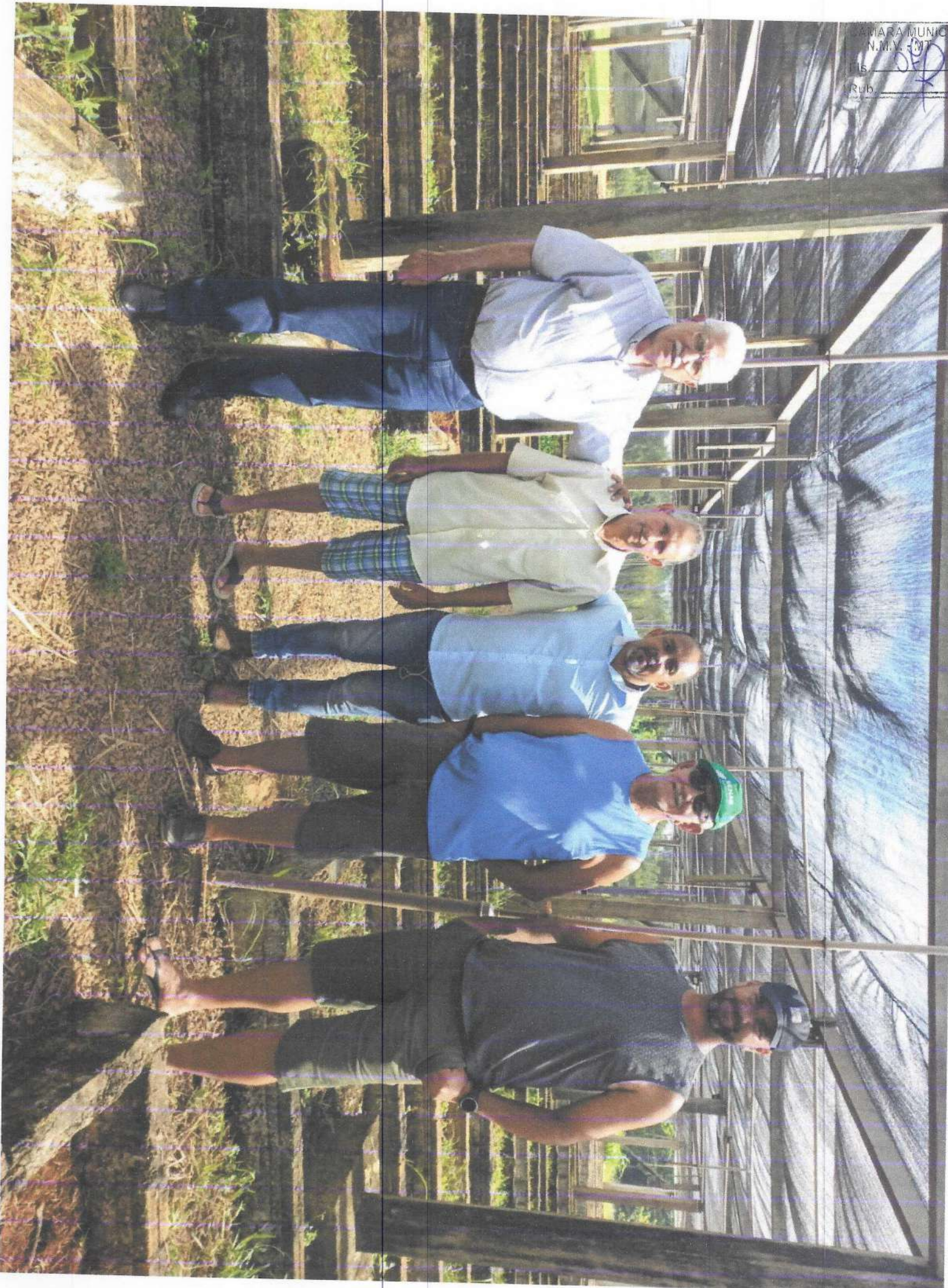
VIVEIRO DE MUDAS N3 ANAGIRANTOS = 19-03-2024